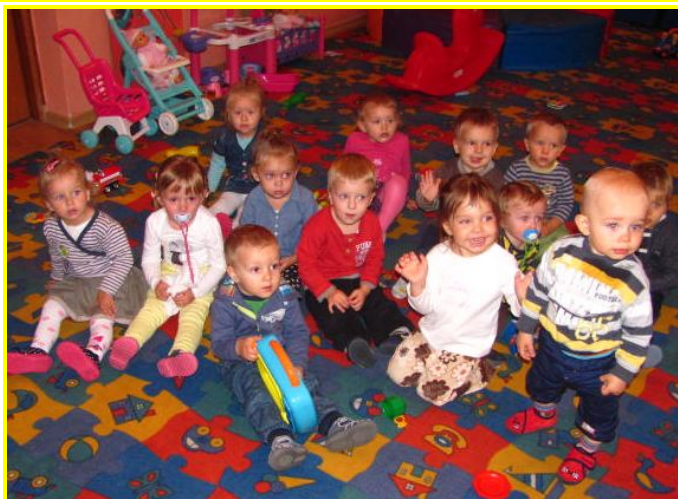
FIOŁKI I RUMIANKI ☺